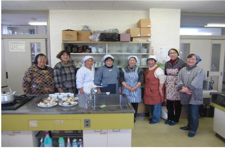
【和気藹々と笑顔が絶えない活動をしています。】

栄養のバランスがとれた献立を大玉村のお母さん達が心を込めて作り、年間22回大玉村の一人暮らしの高齢者等を対象に、お弁当に絵手紙を添えて配送している給食サービスボランティアです。