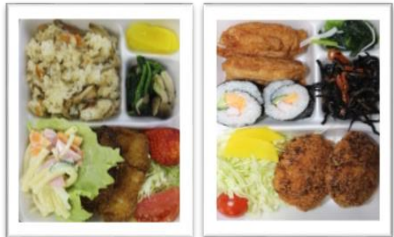
【栄養バランスを考えた献立です。】

かあちゃん弁当の会では、一緒に活動してくれる方を募集しています。活動内容は、お弁当を作る調理ボランティア、作ったお弁当を届ける配送ボランティア、お弁当に付ける絵手紙を書くボランティアがあります。自分が出来ることを無理なく、負担にならない範囲でご協力頂ければと思います。私達と一緒に楽しく活動しましょう。