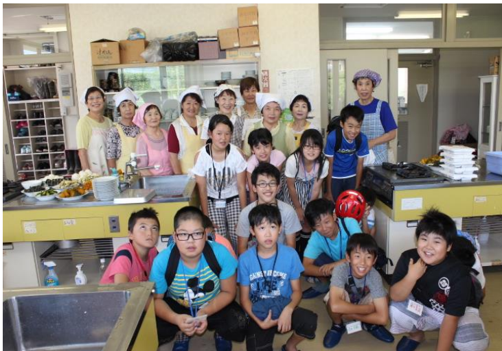
【小学生から高校生までの学生ボランティアも夏休み期間を利用して活動しています。】